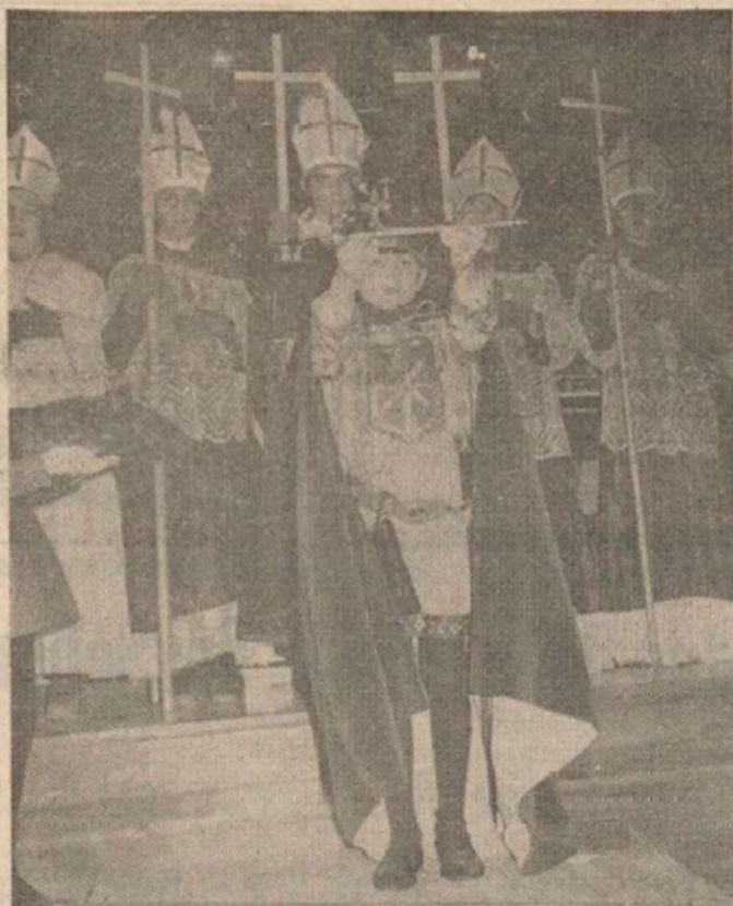
El Rey de la Faba muestra el cetro Real a los presentes durante un momento de la ceremonia de su coronación.