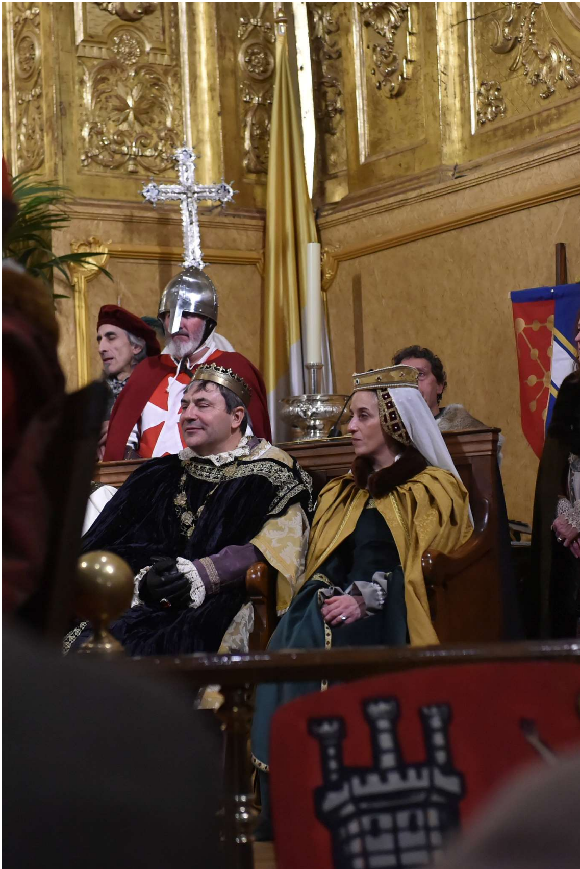
Fotografías de Alberto Galdona Brun

https://www.facebook.com/peraltapormandufotografia/?locale=es ES