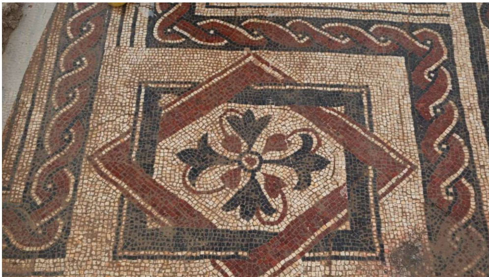
Mosaico de 30 x 9 metros.