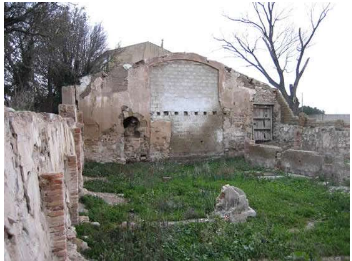
Un arco de herradura.

https://www.youtube.com/watch?v=c_sjCoaNIDk