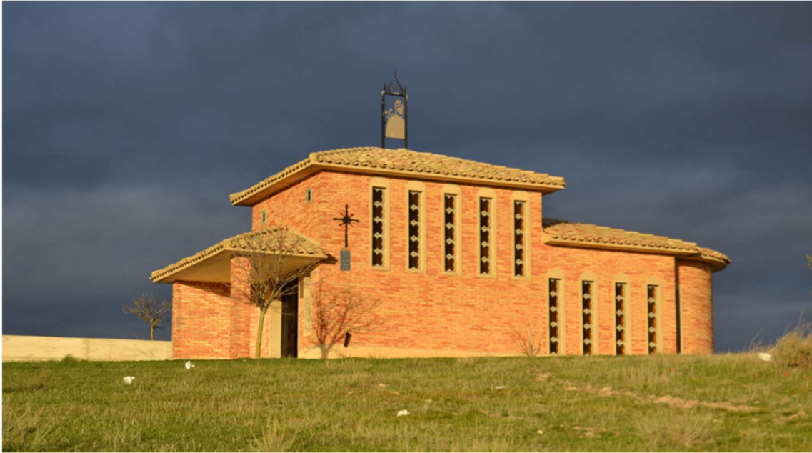
Ermita de San Pedro